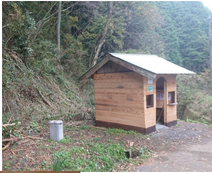
周辺木々の伐採で すっきりしました