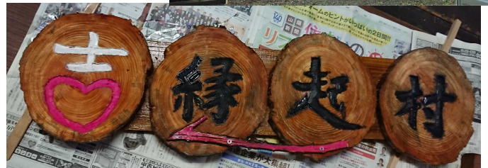
上：旧農協倉庫壁に設置予定の案内看板

右：真庭市マスコットキャラクター「まにぞう」の使用が許可になりました！ 今後はパンフや新聞にも度々現れますのでヨロシクね…。