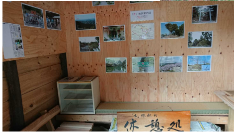
左： 内装完了後に 休憩処内部に 案内写真など 掲示しました