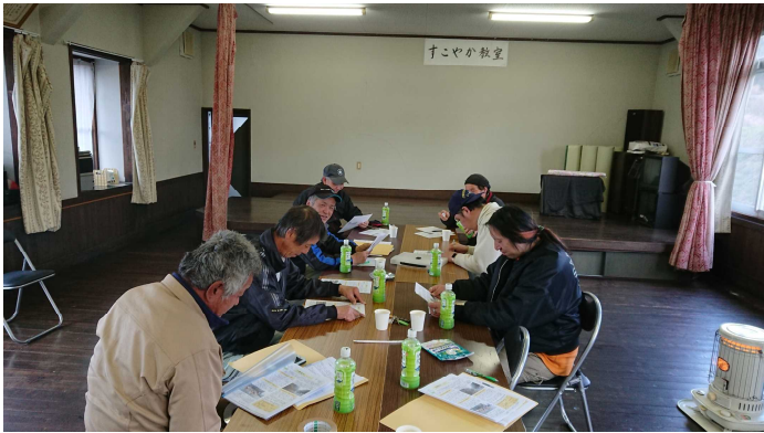
吉縁起村 有志による実行委員会 会合風景

そんな状況の中で、『ただ何もしなくて「吉」を通過地点にしておくのはどうなのか？ 県南に出向く人や県北に来る人たちに、我が「吉」地区をもっと知ってもらい、立ち寄ってもらうことで地域に活力や元気が生まれてくるのでは？』と私たち実行委員会で話をしました。